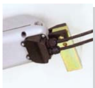
水平式電線出口，安裝時更貼近地面