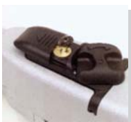
專用鬆油壓鑰匙，容易操作