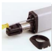
高精密度限制開關，正面的調整